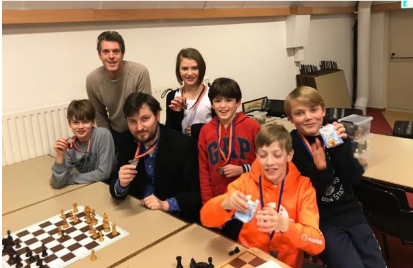
Schaaktoernooi waar de Emmaschool 4 e werd.

In het boekje dat we kregen van Pascal stonden veel verschillende opdrachten bijvoorbeeld mat in 1 en ongedekte stukken slaan zo kregen we een beeld. Nu kunnen we veel beter schaken.